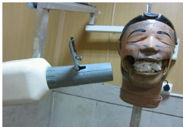
شکل ۱- نشانگر لیزری و فانوم

تصادفی (به هر دانشجوی یک کد داده شد و سپس به صورت تصادفی کدها انتخاب شدند) تقسیم بندی شده بودند شرکت کردند. هر دو گروه، تحت آموزش رادیو عملی ۱ قرار گرفتند، سپس دانشجویان به دو گروه مداخله و مقایسه تقسیم بندی شدند. گروه مداخله با نشانگر لیزری و گروه مقایسه بدون استفاده از نشانگر لیزری تمرین کردند (اشکال ۱-۳).