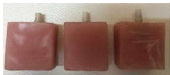
شکل ۱- مجموعه ایمپلنت و اباتمنت‌های زیرکونیایی قرار داده شده در آکريل

برای انجام این مطالعه تجربی از سه ایمپلنت Branemark با اتصال هگزگونال خارجی (Noble biocare AB, Göteborg, Sweden) و Replace با اتصال سه گوش داخلی (Noble active, Noble Biocare AB, Göteborg, Sweden) با اتصال هگزگونال داخلی سوئیچ شونده (Noble biocare AB, Göteborg, Sweden) با قطر متوسط (۴/۳ میلی‌متر) استفاده شد. به منظور یکسان‌سازی موقعیت، هرکدام از مجموعه‌های ایمپلنت و اباتمنت در ظرف پلاستیکی با آکريل خودپلیمریزه شونده (Surveyor GC America INC, Alsip, USI)، با کمک (Degussa, VGI, Germany) به صورت عمود مانت شدند (شکل ۱).