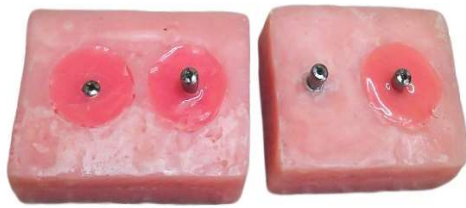
شکل ۲- بلوک‌های آکرلی تهیه شدند به طوری که ایمپلنت‌ها در عمق‌های مختلف آن قرار گرفته‌اند.

نحوه سوار کردن دو قطعه ترانسفر قالب گیری و ایمپلنت به روی هم، قبل از شروع کار به دانشجویان آموزش داده شد. سپس از تمامی دانشجویان انتخاب شده خواسته شد تا ترانسفرهای قالب گیری یا همان ایمپرن کویپنگ‌ها (Hex.close, ارتفاع ۱۵ قطر ۴/۵ میلی‌متر) (Implantium®, Ltd., Seoul Korea) را بر روی چهار ایمپلنت مدل آماده شده ببندند. به دانشجویان ۳ بار فرصت داده شد تا اتصال ترانسفر قالب گیری بر روی ایمپلنت خود را اصلاح نمایند. لازم به ذکر است در صورتی که پس از ۵ بار استفاده از مدل، آنالوگ لته‌ای پاره شده یا آسیب می‌دید، تعویض شده و با یک آنالوگ لته‌ای سالم جایگزین می‌گردید. برای ارزیابی صحت اتصال ترانسفر، از یک مدل نشان‌دار که به صورت ایده‌آل بر روی ایمپلنت بسته شده به عنوان الگو استفاده شد بدین شکل که پس از قرار دادن ترانسفر قالب گیری بر روی ایمپلنت به شکل صحیح، بر روی ترانسفر قالب گیری به موازات لبه ایمپلنت خطی رسم شد و توسط دیسک خراشیده شد به شکلی که پاک نگردد. سپس چهار ترانسفر قالب گیری نشان دار شده بر روی ایمپلنت‌ها توسط پنجاه نفر از دانشجویان سال آخر رشته دندان پزشکی بسته شد. در نهایت، بعد از حذف لته شبیه سازی شده، با توجه به خطوط رسم شده روی ترانسفرهای قالب گیری میزان صحت اتصال (با توجه به عمق) به وسیله یک ذره بین با بزرگنمایی ۴x توسط یک متخصص پروتز مجرب سنجیده شد. اطلاعات به دست آمده از پنجاه دانشجو در یک جدول به صورت نشست صحیح یا ناصحیح برای هر چهار ایمپلنت ثبت شد. داده‌های جمع‌آوری شده توسط تست آماری Cochran's Q مورد آنالیز آماری قرار گرفتند. خطای نوع اول آماری برابر ۰/۰۵ در نظر گرفته شد، همچنین عملیات آماری با استفاده از نرم‌افزار SPSS 22 (Spss Inc., Chicago, IL, USA) انجام شد.