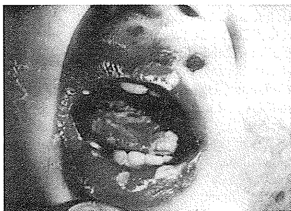
تصویر شماره ۱- برفک ایجادشده در سطح زبان، گونه و گوشه لب و زخمهای متعدد در سطح پوست صورت

قادر به ایجاد عفونت در افراد سالم نیستند. کاندیدیازیس پوستی، مخاطی مزمن در اثر اختلال در دستگاه ایمنی سلولی میزبان به وجود می آید؛ در ضمن کمبود روی و آهن را جزو عوامل مستعدکننده بیماری به حساب آورده‌اند (۱۵،۵).