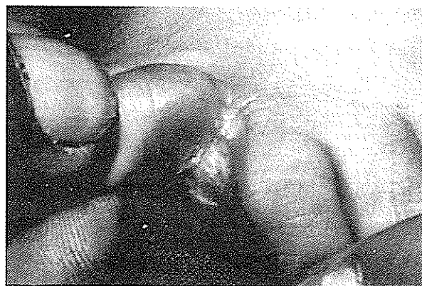
تصویر شماره ۴- ضایعات کاندیدیایی بین انگشتان

از نظر شمارش لنفوسیت‌های T در خون محیطی از آزمون روزت (Rosette) استفاده گردید و میزان IgM و IgG و IgA در بیماران ارزیابی گردید (جدول شماره ۵).