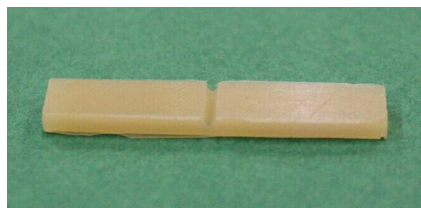
شکل ۱- الف: شکل نمونه