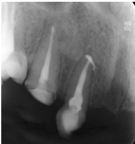
شکل ۷- فالوآپ ۶ ماهه