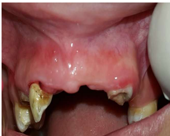
شکل ۴- بهبود سینوس ترکت

پس از تهیه رضایت نامه شفاهی و کتبی از بیمار، پیش از شروع درمان کانال ریشه، بیمار از تشخیص و طرح درمان مطلع شد. سپس بی حسی موضعی لیدوکائین ۲٪ با اپی نفرین ۱/۸۰۰۰۰ تزریق شد و دندان ۱۲ با رابردم ایزوله و حفره دسترسی با هندپیس با سرعت بالا تحت اسپری آب و هوا تهیه شد. کانال‌ها با ۲.۵٪ NaOCl (Diluted chloraxid 5.25% cerkamed, medicalcompany, Poland) شستشو داده شد و طول کارکرد دندان با اپکس لوکتور (Meta biomed, southkorea) I root اندازه‌گیری و با رادیوگرافی تأیید شد. آماده سازی بیومکانیکال کانال‌ها با فایل روتاری نیکل تیتانیوم (Dentsply, mailifer) Protaper به روش crown down تا فایل F4