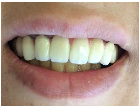
شکل ۹- پس از درمان پروتز

با توجه به نیاز مبرم به ایجاد سیل سه بعدی و درمان پر چالش دندان‌های با تحلیل داخلی ریشه، روش‌های مختلفی برای پرکردن این دندان‌ها مطرح شده‌اند که از جمله آن‌ها به روش single cone و استفاده از سیلرهای با بیس کلسیم سیلیکات می‌توان اشاره کرد. لذا در کیس مورد بررسی از روش single cone و سیلر Endosel MTA استفاده گردید.