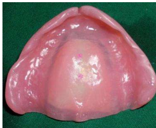
شکل ۶- ایجاد روزنه ورودی و خروجی در سطح بافتی دنچر ماگزایلا (۸)

(و) بزاق مصنوعی توسط یک سرنگ ۵ میلی‌لیتری، از طریق روزنه وارد مخزن می‌شود.