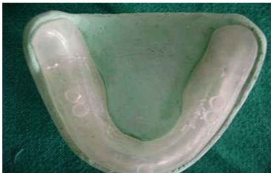
شکل ۲- قسمت بیس وکس آپ شده توسط آکریل شفاف دوبلیکیت می‌شود