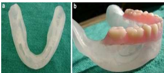
شکل ۳- الف) مخزن بزاقی در بیس شفاف آکریلی قرار داده می‌شود. ب) بزاق مصنوعی درون مخزن قرار داده می‌شود و دو قسمت بیس و دندانی دنچر به هم متصل می‌شوند.