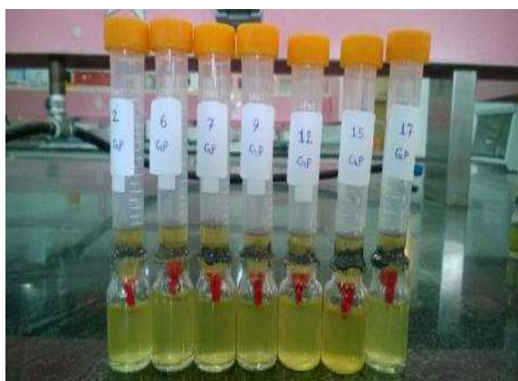
شکل ۳- اندازه گیری ریزنشت به روش نفوذ باکتریایی در نمونه‌های گوتاپرکا در روز سی ام

برای تعیین میزان نشت باکتری در گروه‌های A و B، پس از آماده سازی نمونه‌ها، از تیوب‌های فالکن استفاده شد، طوری که قسمت انتهایی آن برش خورده و نمونه‌ها طوری درون تیوب قرار گرفتند که ۱۳ میلی متر از ریشه تیوب بیرون باقی بماند. برای جلوگیری از نشت، محل اتصال نمونه‌ها و تیوب با استفاده از چسب سیانوآکریلات و موم چسب پوشانده شد. سپس نمونه‌ها توسط گاز اتیلن اکساید استریل شده و محیط کشت مولر- هینتون (Muller-Hinton) حاوی سوسپانسیون باکتری انتروکوک فکالیس ATCC 29212 با غلظت 10^8 \times 0.5 CFU/mL به چمبر بالایی اضافه شد. چمبر پایینی نیز با استفاده از محیط کشت مولر هینتون پر گردید. کدورت محیط کشت چمبر پایینی به صورت روزانه بررسی و گزارش شد. جهت اطمینان از زنده بودن باکتری هر سه روز یک بار، محلول باکتری موجود در چمبر بالایی با باکتری جدید جایگزین شد. همچنین هنگام کدر شدن محیط کشت در هر نمونه، با رعایت شرایط استریل و در مجاورت شعله، توسط آنس استریل (رازی، ایران) از آن نمونه برداری و در محیط کشت جامد بلاد آگار (خون گوسفند: شرکت دارواش، تهران، ایران- محیط: Himedia, India) کشت داده شد. سپس در حرارت ۳۷ درجه سانتی گراد به مدت ۴۸ ساعت انکوبه و پس از آن مورفولوژی کلنی‌ها از لحاظ ماکروسکوپی مورد بررسی قرار گرفت. همچنین برای تأیید وجود باکتری انتروکوک فکالیس از کلنی‌ها اسمیر تهیه و با روش گرم، رنگ آمیزی شدند و در آخر زیر میکروسکوپ نوری مورد بررسی قرار گرفتند (اشکال ۲ و ۳).