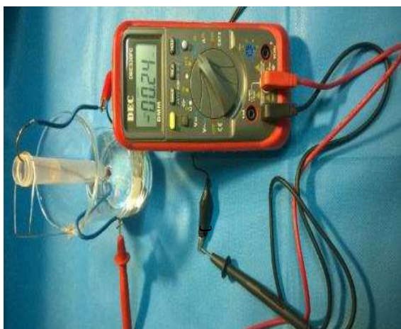
شکل ۱- اندازه گیری ریزنشت با استفاده از روش هدایت الکتریکی

ابتدا تمام نمونه‌ها از نظر میزان هدایت الکتریکی بررسی شدند. در این روش از دو الکتروود با جنس یکسان استفاده شد. همچنین از محلول نرمال سالین ۰/۹٪ به عنوان الکتروولیت استفاده گردید. کانال ریشه با الکتروولیت پر شده و سپس به الکتروود درون آن قرار گرفت. قسمت اپیکال ریشه نیز داخل محلول الکتروولیت غوطه‌ور شد. الکتروود بعدی نیز درون محلول الکتروولیتی که ریشه را احاطه کرده قرار گرفت. هر نمونه در برابر جریان مستقیم ۸ ولت قرار گرفت (۱۷). در صورت وقوع نشت الکتروولیت از کنار پر کردگی، یک جریان الکتریکی برقرار شده که متناسب با میزان نشت است. این میزان از طریق اندازه گیری جریان انتقال یافته توسط مولتی متر ارزیابی شد (شکل ۱).