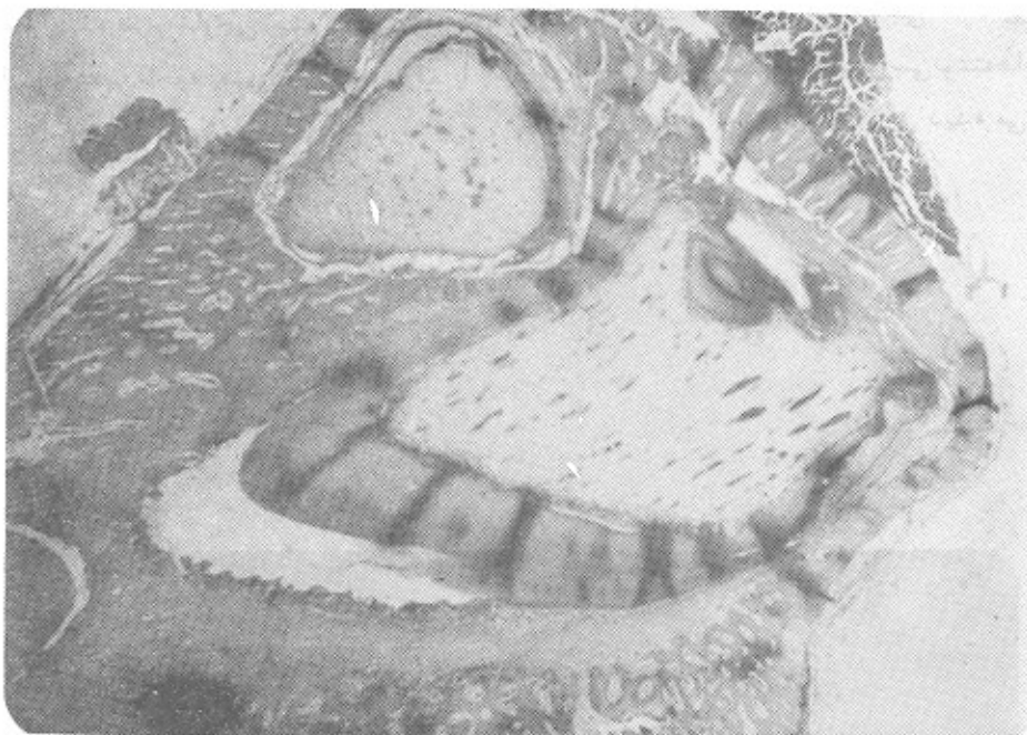
تصویر شماره (۲): نمونه تاجی Dens in dente در جوانه دندانی تکامل یافته موش.