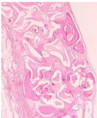
شکل ۷- استخوان سازی در گروه Bio-Oss (بزرگنمایی ۲۰X)