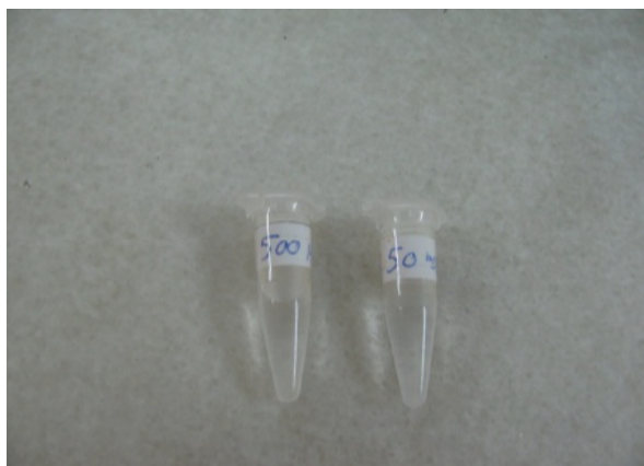
شکل ۱- ترکیبات آماده شده برای روز جراحی

لاکتوفرین مورد نظر از کارخانه Sigma خریداری شده و قبل از جراحی لاکتوفرین مورد نیاز در در بخش تغذیه و بیوشیمی دانشکده بهداشت به صورت محلول در سرم در آمده و غلظت‌های مورد نظر (۵۰۰ و ۵۰ μg/ml) در حجم مورد نیاز آماده شدند (لاکتوفرین بدون آهن) (شکل ۱).