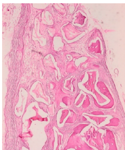
شکل ۶- استخوان سازی گروه در Bio-Oss و لاکتوفرین ۵۰۰ µg/ml (بزرگنمایی ۲۰X)

در نهایت داده‌ها وارد محیط نرم‌افزاری SPSS شدند و متغیرهای