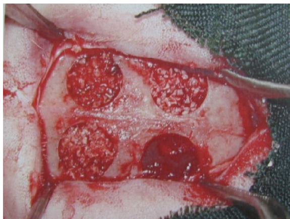
شکل ۴- پر شدن نقص‌ها توسط مواد مورد نظر