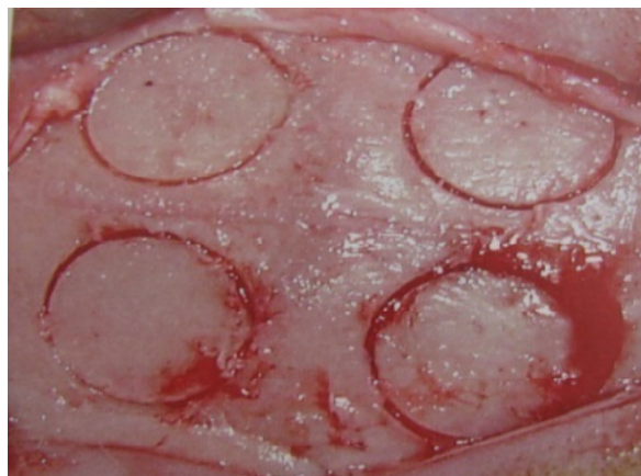
شکل ۲- ایجاد نقص‌های هم اندازه

خرگوش‌ها به وسیله مخلوطی از ۲٪ Xylazine و ۱۰٪ Ketamin بیهوش شدند. ناحیه کالواریوم با بتادین اسکراب شده، موهای ناحیه با تیغ ریش تراش به دقت تراشیده شد. یک برش قدامی- خلفی (کرانیوکوتال) به طول ۱۰ سانتیمتر ایجاد و پوست و پریوست به وسیله یک الواتور پریوست کنار زده شد. با فرز Trephine به قطر ۶ میلی‌متر، ۴ سوراخ یک شکل و یک اندازه در ناحیه عمل در کالواریوم ایجاد گردید (دو حفره در استخوان فرونتال و دو حفره در استخوان پرینتال) (شکل ۲).