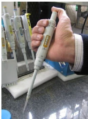
شکل ۳- برداشتن ۷۰ میکرولیتر لاکتوفرین با Sampler

نمونه اول محل ترکیبات مورد استفاده به طور تصادفی تعیین شد و در نمونه‌های بعدی موقعیت آنها به صورت چرخش ساعتگرد تغییر کرد. برای اجتناب از هرگونه اشتباه برای هر نمونه یک جدول تهیه گردید که در آن اطلاعات مربوط به هر نمونه آورده شد. پس از قرار دادن مواد در حفرات مورد نظر، پریوست با بخیه Vicryl ۴/۰ و پوست کالواریوم با نخ بخیه نایلون ۳/۰ سوچور شد.