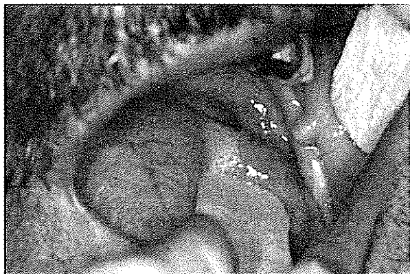
تصویر شماره ۱ نمای بالینی آنژیولیپوما

تصویرهای شماره ۱-۴ گزارش تصویری مورد می باشد: