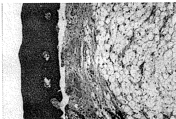
تصویر شماره ۳ پرولیفراسیون سلولهای چربی بالغ به همراه عروق خونی در زیر مخاط (H&E ×۱۰۰)

لرزش و صدایی احساس نمی شد (Brait و Thrill). اندازه تقریبی آن ۰/۵ \times ۰/۵ \times ۰/۵ سانتی متر بود. بیمار از وجود چنین ضایعه‌ای در دهان اطلاع داشت و زمان تقریبی به وجود آمدن آن را از ۳ سال پیش، بدون هیچ گونه سابقه درد و یا تراما ذکر کرد.