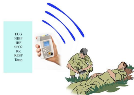
شکل ۲) سیستم ارسال گزارش از وضعیت بیمار

بنابراین یک سیستم تله متری طراحی شده برای مناطق عملیاتی باید یا دارای بستری مناسب برای ارسال علائم حیاتی باشد. هم اکنون مناسبترین بستر برای فعالیت های نظامی، فیبر نوری است که باید زیرساخت های آن از قبل فراهم شده باشد.