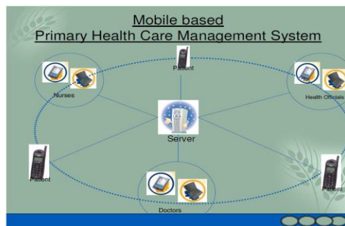
شکل ۳- سیستم مراقبت بهداشتی اولیه مبتنی بر تلفن همراه

شهر الکترونیک Bangalore توسعه "سیستم مراقبت اولیه بهداشتی مبتنی بر تلفن همراه" را برای به کارگیری در PHC به منظور بهتر کردن مدیریت مراقبت بهداشتی اولیه به خصوص در مناطق زاغه نشین شهری و روستایی آغاز نمود. این سیستم از اطلاعات کامل مربوط به بیماران درمان شده در یک PHC به دست خواهد آمد. این نرم افزار از توسعه مدیریت پایگاه داده بیمار، تعامل بین پزشک و بیمار، دستیابی به داده های پزشکی مثل ECG، تصاویر قلب، ریه، چشم و غیره و مدیریت برنامه ریزی تشکیل شده است [۳].