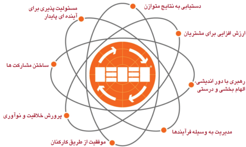
شکل (۱) - مفاهیم بنیادین تعالی سازمانی

جایزه ملی جهت پیاده سازی این مفاهیم و ارائه چهارچوبی اجرایی برای نهادینه سازی مفاهیم بنیادین، الگوی تعالی سازمانی ۲ خود را مطابق شکل (۲) طراحی و ارائه نموده است. این الگو به دو حوزه اصلی تقسیم می‌شود: توانمندسازها ۳ و نتایج ۴ .