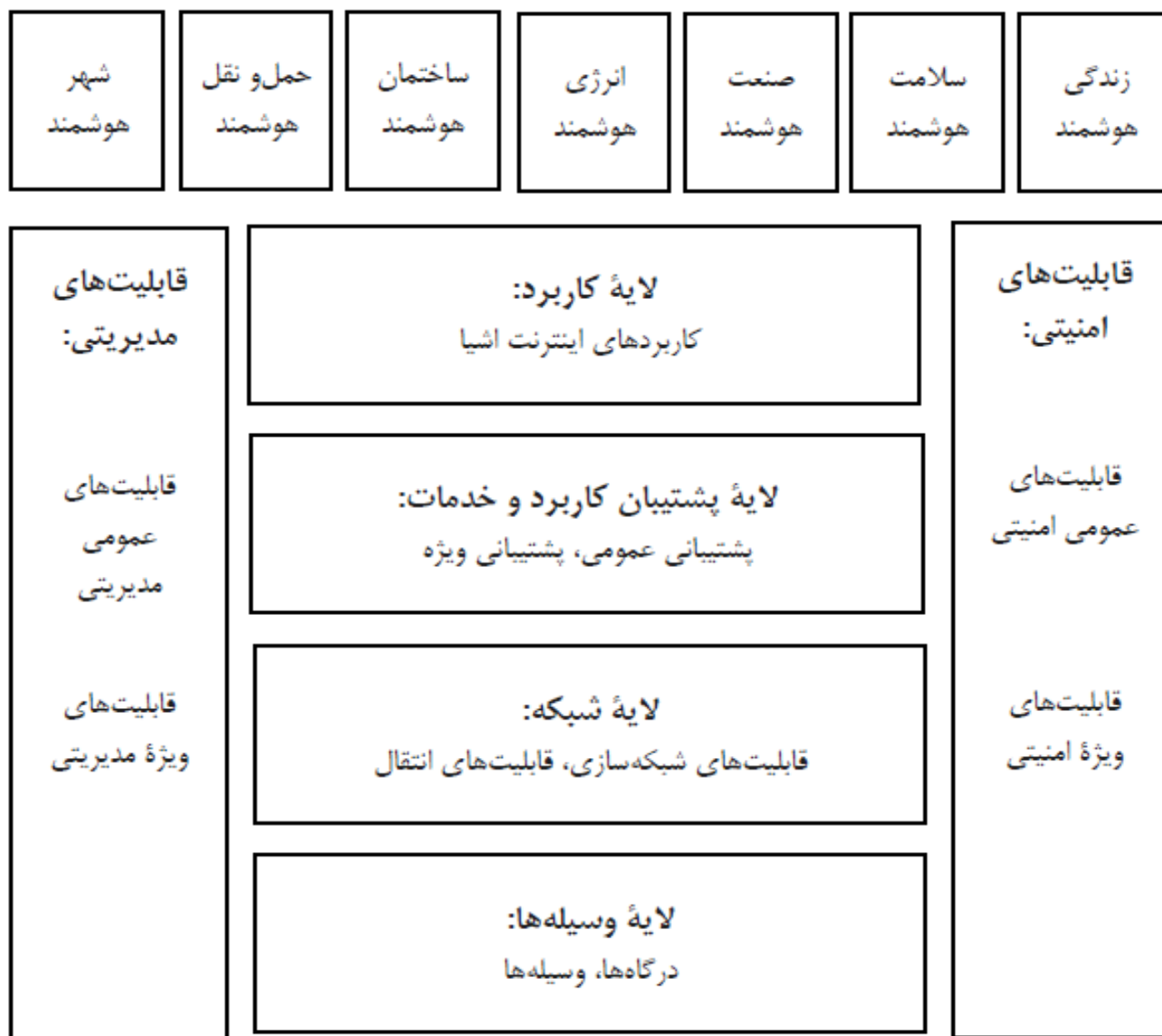
شکل ۱. مدل معماری اینترنت اشیا اتحادیه بین‌المللی ارتباطات