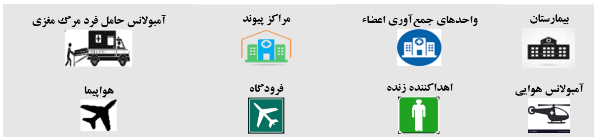
شکل ۲- طرح شماتیک مسئله

تابع هدف اول زمان انتقال اهداکننده از بیمارستان به واحد جمع آوری اعضا و مرکز پیوند، زمان انتقال دریافت کنندگان عضو در منطقه مورد بررسی به مرکز پیوند جهت دریافت عضو، زمان انتقال عضو از واحد جمع آوری اعضا به مرکز