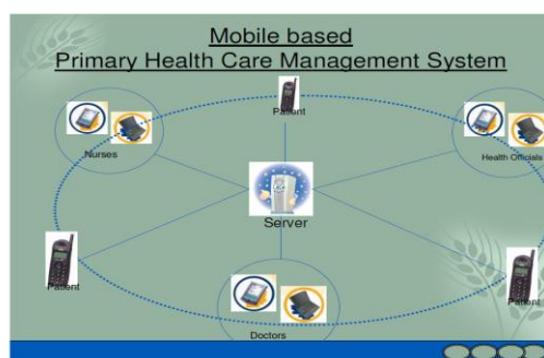
شکل ۳- سیستم مراقبت بهداشتی اولیه مبتنی بر تلفن همراه

شهر الکترونیک Bangalore توسعه "سیستم مراقبت اولیه بهداشتی مبتنی بر تلفن همراه" را برای به کارگیری در PHC به منظور بهتر کردن مدیریت مراقبت بهداشتی اولیه به خصوص در مناطق زاغه نشین شهری و روستایی آغاز نمود. این سیستم از اطلاعات کامل مربوط به بیماران درمان شده در یک PHC به دست خواهد آمد. این نرم افزار از توسعه مدیریت پایگاه داده بیمار، تعامل بین پزشک و بیمار، دستیابی به داده های پزشکی مثل ECG، تصاویر قلب، ریه، چشم و غیره و مدیریت برنامه ریزی تشکیل شده است [۳].