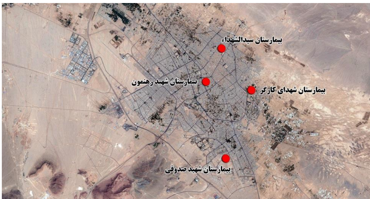
تصویر ۱- موقعیت نمونه‌های مورد مطالعه در شهر یزد

نمونه مورد مطالعه در این پژوهش بیمارستان‌های دولیت در شهر یزد می‌باشند. به همین منظور ۴ بیمارستان به‌منظور تکمیل پرسشنامه از بیماران در نقاط مختلف شهر که دارای