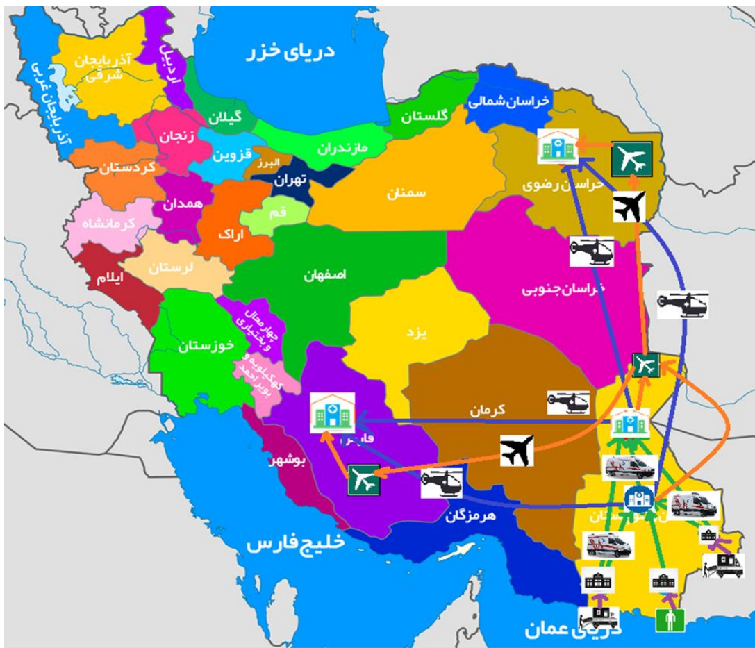
شکل ۱- شبکه‌ی زنجیره تأمین پیوند عضو