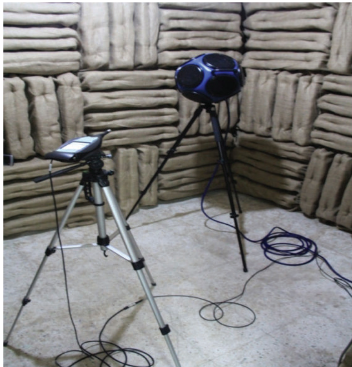
شکل ۱: ست اندازه‌گیری زمان بازآوایی به روش صدای منقطع

مرحله طراحی و نقشه اجرایی آکوستیکی اتاق با نرم افزار AutoCAD و MAX 3D قبل از کار با نرم افزار زمان بازآوایی مورد هدف، سطح جذب مورد هدف و سطح کلی مورد هدف در فرکانس معین شده به منظور طراحی با نرم افزار، تعیین گردید.