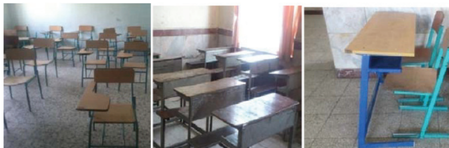
الف ب ج

شکل ۲: میز و نیمکت‌های مورد استفاده در مدارس ابتدایی شهر همدان (الف) میز مشترک با صندلی جدا (ب) میز و نشیمن‌گاه مشترک (ج) صندلی تک نفره