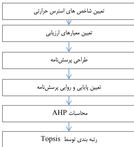
شکل ۱. مراحل انجام تحقیق

یکی از مهم‌ترین سوالاتی که در ذهن متخصصان ایمنی و بهداشت حرفه ای وجود دارد این است که بهترین شاخص ارزیابی استرس‌های حرارتی با توجه به گستردگی آن که بتوان نتایج قابل قبولی را داشته باشد چیست؟ و چگونه می‌توان آن را مورد قبول قرار داد. لذا در این تحقیق با هدف تعیین شاخص بهینه استرس حرارتی در صنایع گرم به اجراء در آمد.