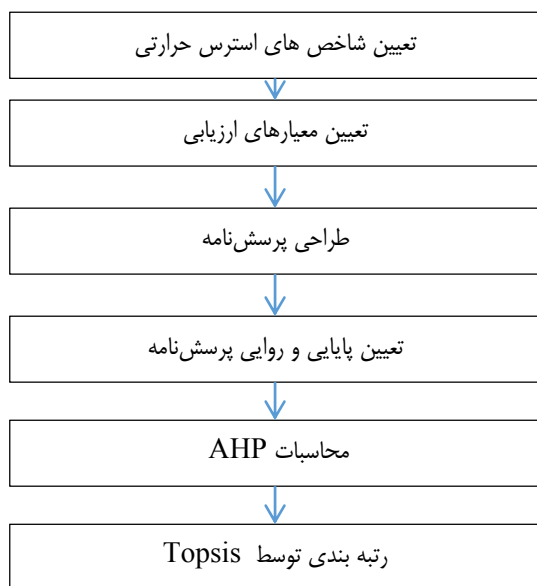
شکل ۱. مراحل انجام تحقیق

یکی از مهم‌ترین سوالاتی که در ذهن متخصصان ایمنی و بهداشت حرفه ای وجود دارد این است که بهترین شاخص ارزیابی استرس‌های حرارتی با توجه به گستردگی آن که بتوان نتایج قابل قبولی را داشته باشد چیست؟ و چگونه می‌توان آن را مورد قبول قرار داد. لذا در این تحقیق با هدف تعیین شاخص بهینه استرس حرارتی در صنایع گرم به اجراء در آمد.