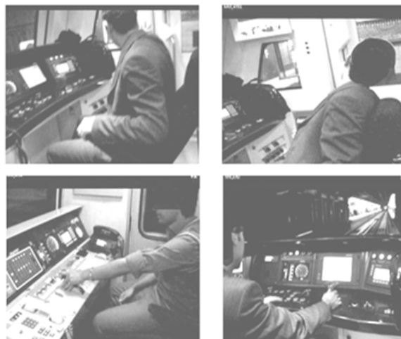
شکل ۱. مشاهده حرکات راهبران جهت واکاوی وظایف و ارزیابی بار کار فیزیکی

در این مرحله، از روش واکاوی وظیفه نظیر آن‌چه که روز و بیرمن (۲۰۱۲) و کارونن و همکاران (۲۰۱۱) در صنعت ریلی سنتی انجام دادند استفاده شد که در آن وظایف شغلی در یک فرایند سلسله مراتبی به مجموعه‌ای از زیر وظایف تقسیم شده و در قالب چارت ارایه گردید (۲، ۸). از روش‌های مختلفی برای تحلیل وظایف استفاده شد به این ترتیب که ابتدا مستندات و سوابق شغل راهبری به روش تحلیل محتوا مورد مطالعه قرار گرفت و وظایف یادداشت برداری گردید. سپس دو ارزیاب یکی به صورت مستقیم و دیگری از طریق فیلم برداری، حرکات و عمل‌کردهای ۲۱ راهبر را در خطوط ۱، ۲، ۳ و ۵ و پایانه‌های مترو ثبت و ضبط کردند (شکل ۱). مشاهدات