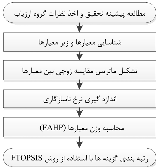
شکل ۱. چارچوب روش پیشنهادی

با توجه به افزایش و رشد پروژه‌های بلندمرتبه‌سازی و خطرات ویژه این نوع ساخت‌وسازها، ارزیابی فرهنگ ایمنی در کارگاه‌های بلندمرتبه‌سازی از اهمیت و ضرورت به‌سزایی برخوردار است. بنابراین کارگاه مورد مطالعه، یک برج اداری-تجاری ۳۳ طبقه فولادی است که در مرحله اجرای اسکلت فلزی و سفت‌کاری قرار داشته و بخشی از یک مگا پروژه تجاری-اقامتی و اداری با زیربنای کل حدود ۶۰۰،۰۰۰ مترمربع محسوب می‌شود. در شکل ۱ جزئیات روش پیشنهادی رتبه‌بندی مشاغل در کارگاه‌های بلندمرتبه‌سازی از نظر فرهنگ ایمنی با استفاده از مدل FTOPSIS-FAHP نشان داده شده است.