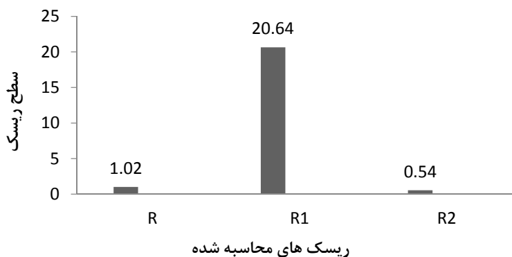
شکل ۲. سطح ریسک برای ساختمان و محتویات ( R )، ساکنین ( R_1 ) و فعالیت ها ( R_2 ) در وضعیت موجود

در این پژوهش از روش ارزیابی مهندسی ریسک حریق FRAME، جهت تعیین کمی ریسک حریق ساختمان، فعالیت ها و ساکنین اتاق کنترل استفاده شد. نتایج نشان می دهد، ریسک حریق برای ساکنین ( R_1 )، با میزان ۲۰/۶۴ بالاترین سطح را دارد. ریسک حریق ساختمان و محتویات ( R ) نیز ۱/۰۲ به دست آمد. از آن جا که مطابق راهنمای روش FRAME، سطح ریسک قابل قبول کم تر از ۱ می باشد، لذا ریسک حریق ساکنین و ساختمان و محتویات در این پژوهش در