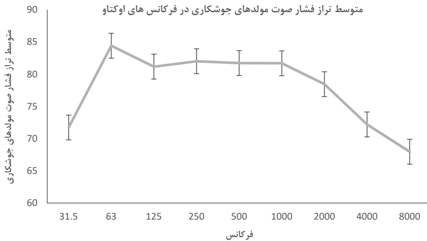
شکل (۲) - متوسط تراز فشار صوت مولد های جوش کاری در فرکانس های اوتکت

که در شرایط خاموش بودن مولد های دیزلی اندازه گیری شده بود، از حدود مجاز سازمان محیط زیست (۵۵ دسی بل در طی ساعات ۸ صبح الی ۱۰ شب) تجاوز کرده بود و این تجاوز از حدود مجاز به دلیل صدای ناشی از ترافیک و تردد خودروها در اطراف سایت های ساخت و ساز بود. (جدول ۱) لذا با توجه به صدای زمینه موجود، حتی در شرایطی که مولدهای دیزلی خاموش هستند صدا از حدود مجاز سازمان محیط زیست تجاوز خواهد کرد و در صورت استفاده از استاندارد موجود سازمان محیط زیست ارزیابی صحیحی از صدای ناشی از مولد های دیزلی صورت نخواهد گرفت. در این مطالعه، حدود مجاز صدای محیط زیستی با اقتباس از استاندارد BS 5228 (صدای زمینه به اضافه ۵ دسی بل) بر اساس صدای زمینه موجود در هریک از سایت های ساخت و ساز به دست آمد، لذا هریک از سایت های ساخت و ساز حدود مجاز مختص به خود را خواهد داشت. متوسط تراز صدای زمینه در ۱۴ سایت ساخت و ساز بررسی شده در این مطالعه ۴۶/۲۰ دسی بل اندازه گیری