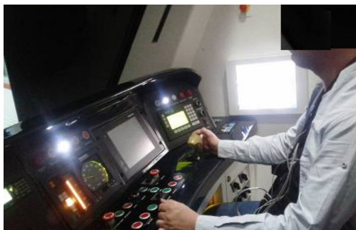
شکل (۲) - ثبت داده‌های فیزیولوژیک در حین راهبری

در این مطالعه HR/HRV و بارکار فکری درک شده و امتیاز عمل کرد به‌عنوان متغیرهای وابسته و سطوح مطالبه شغلی در سناریوهای مختلف راهبری به‌عنوان متغیرهای مستقل در نظر گرفته شدند. تفسیر داده‌های فیزیولوژیک زیر نظر یک متخصص فیزیک پزشکی و با استفاده از دستورالعمل انجمن کاردیولوژی اروپا و الکتروفیزیولوژی آمریکا انجام شد (۱۸). جهت اطمینان از قابلیت اعتماد داده‌های فیزیولوژیک ثبت‌شده با ECG، داده‌های ۵ دقیقه اول هر آزمون حذف شد. به دلیل این‌که داده‌های قلبی افراد مختلف به‌شدت تحت تأثیر اختلافات فردی است، واکنش‌های قلبی راهبران به درجات مختلف بارکار فکری شغلی با خود آن‌ها مقایسه شد و از مقایسه بین فردی خودداری گردید (۲۳). میانگین و انحراف معیار پارامترهای HR/HRV در دو سناریو مقایسه شد و به‌منظور آزمون فرضیه موردنظر از روش آماری ویلکاکسون استفاده گردید. به‌منظور