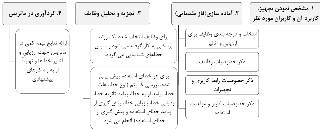
شکل (۱) - الگوریتم مراحل روش PUEA