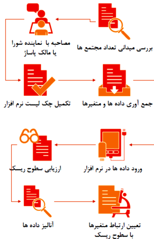
شکل ۱- فلودیاگرام روش بررسی مطالعه

بازار و مداخلات آموزشی در بین شاغلین بایستی انجام گردد (۵). مطالعه حاضر سعی در جبران این خلاء نموده است. به منظور بررسی وضعیت ایمنی مجتمع‌های تجاری تهران، ناحیه منطقه ۱۲ شهرداری که دارای بیشترین تراکم مجتمع‌ها بوده و دارای اهمیت استراتژیک سیاسی، اقتصادی، فرهنگی و تاریخی می‌باشد، جهت اجرای مطالعه انتخاب گردید.