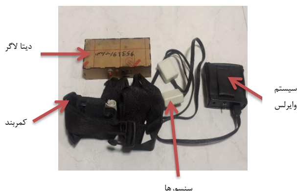
شکل ۱. الف) دستگاہ آنالیز حرکتی طراحی شده، ب) استفاده از دستگاہ آنالیز حرکت در صنعت خودروسازی

طراحی شده می باشد. بعد از طراحی و تست عملکرد دستگاہ، در مرحله بعدی از مطالعه، با توجه به حجم نمونه مورد نیاز، افراد شرکت کننده از ایستگاہ های کاری که در مرحله سوم مطالعه بعنوان ایستگاہ های با ریسک بالا شناسایی شده اند به طور تصادفی انتخاب و آنالیز حرکات کمر با استفاده از ابزار طراحی شده برای این افراد انجام شد. به خاطر محدودیت های امنیتی و مسائل مربوط به کسب اجازه ورود و خروج از کارخانه امکان نصب دستگاہ بر روی هر فرد به مدت ۸ ساعت امکان پذیر نبود بنابراین با توجه به تکراری بودن وظایف، برای هر فرد حداقل ۱۰ سیکل کاری کامل با دستگاہ ثبت گردید. نهایتاً، در مرحله آخر، داده های اخذ شده از مطالعات مشاهده ای و بررسی های دستگاہی با استفاده از روش های متعدد آماری شامل آلفای کرونیباخ، Mann-Whitney و Kruskal-Wallis، و ضریب همبستگی پیرسون مورد آزمون های آماری قرار گرفتند. آلفای کرونیباخ و ضریب همبستگی به کمک نرم افزار SPSS نسخه ۱۸ بترتیب ۰/۸۵ و ۰/۸۲ بدست آمد.