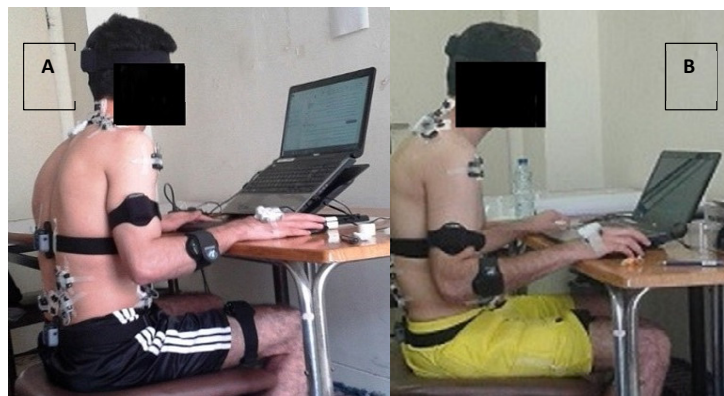
Fig. 1. The participants working with laptop in the ergonomic (A) and conventional (B) setups

In this study, 20 young healthy male university students (age: 27.05 \pm 3.5 years, height: 176.9 \pm 5.5 cm, weight: 71 \pm 11.8 kg, BMI: 22.4 \pm 3.0 ) were selected based on voluntary sampling. The participants sat on a chair without a backrest and armrest to reduce the physical contact to the measuring sensors hooked up to the participants. They performed mouse work and typing tasks with a laptop in the conventional and ergonomic workstation setups. In the conventional setup, the laptop was placed on a desk whose height was adjusted to be 5 cm above the elbow level. Regarding ergonomic setup, a height adjustable riser (Cooling Pad, 638 (A), China) was placed underneath the laptop on the desk for adjusting its screen height, and the top edge of the laptop screen was adjusted at participants' eye levels. Further, an external keyboard (XP-product, XP-8004, China) was used in the ergonomic setup for typing (Figs. 1. A & B). The duration of performing each task (mouse work and typing) in each setup was eight minutes. There