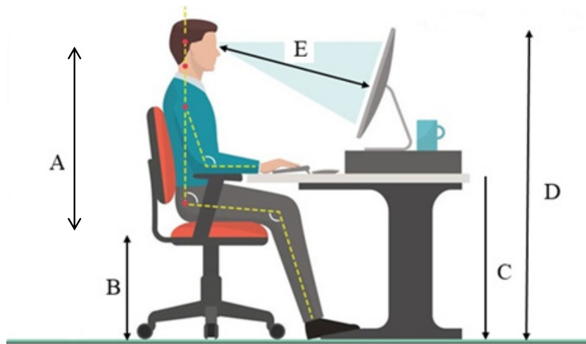
شکل ۱. ارتفاع چشم نشسته (A)، ارتفاع نشیمنگاه (B)، ارتفاع میز (C)، ارتفاع لبه فوقانی مانیتور (D)، فاصله چشم تا مرکز مانیتور (E)

این متون با فونت و اندازه مشخص در مرکز صفحه‌نمایش کامپیوتر نشان داده می‌شود. جهت اعتبارسنجی و ارزیابی صحت و دقت نرم‌افزار طراحی‌شده، تعداد پلک زدن در چند فیلم به صورت تصادفی و دستی (چشمی) شمارش شد. این فیلم‌ها در نرم‌افزار فراخوانی شده و مجدداً با استفاده از نرم‌افزار شمارش به صورت اتوماتیک انجام شد. سپس، میزان همبستگی و دقت موردبررسی قرار گرفت و نتایج نشان داد نرم‌افزار با ضریب همبستگی ۰/۹۵ از دقت بالایی در شمارش صحیح و دقیق نرخ پلک برخوردار است. در این مطالعه سرعت پلک زدن افراد نیز موردبررسی قرار گرفت. جهت تعیین سرعت پلک زدن، زمان بسته و باز شدن کامل چشم برحسب میلی‌ثانیه در نظر گرفته شد. اساس کار جهت تعیین سرعت پلک زدن (زمان باز و بسته شدن چشم) بدین صورت است که زمانی که چشم در حالت باز و خواندن متن می‌باشد به صورت چشم باز در نظر گرفته می‌شود و به محض اینکه پلک حرکت کرده و فرآیند پلک زدن آغاز می‌شود، محاسبه زمان بسته و باز شدن چشم تا باز شدن کامل چشم شروع می‌شود. در خصوص نحوه کار با نرم‌افزار، به‌طور کلی، تصاویر ضبط‌شده از چهره افراد، در نرم‌افزار فراخوانی شده و آنالیزهای مربوطه هر بار به صورت مجزا انجام می‌گرفت. در انتها، خروجی به صورت اکسل نمایش داده شده