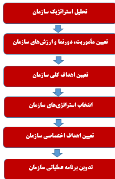
شکل ۱. مدل برنامه‌ریزی استراتژیک مصدق‌راد (۱)