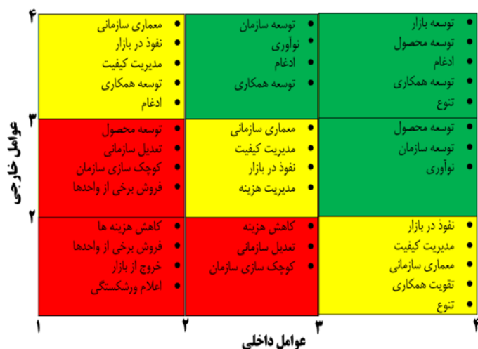
شکل ۳. استراتژی‌های پیشنهادی گروه بهداشت حرفه‌ای دانشگاه علوم پزشکی تهران

«قوت» و «قوت زیاد» به ترتیب امتیاز ۱، ۲، ۳ و ۴ داده شد. در مورد عوامل خارجی، به «تهدید جدی»، «تهدید»، «فرصت» و «فرصت زیاد» به ترتیب امتیاز ۱، ۲، ۳ و ۴ داده شد. از ماتریس موقعیت استراتژیک مصدق‌راد (۱۳۹۴) برای تعیین موقعیت گروه بهداشت حرفه‌ای (شکل ۲) و تعیین استراتژی‌های دستیابی به اهداف کلی (شکل ۳) استفاده شد (۱).