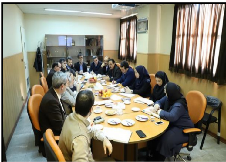
تصویر ۱: جلسات برنامه‌ریزی استراتژیک گروه‌های بهداشت حرفه‌ای دانشگاه علوم پزشکی تهران