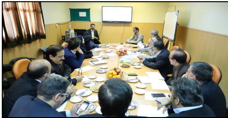
شکل ۳: ماتریس استراتژی های پیشنهادی (۱۰)