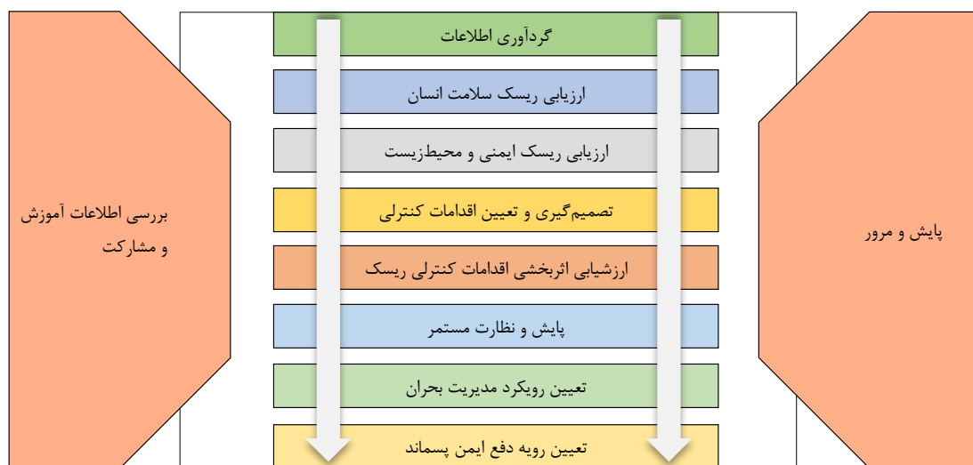
شکل ۳: فرآیند کلی توسعه یافته در مدیریت ریسک نانومواد مهندسی‌شده (۴۹، ۵۰)