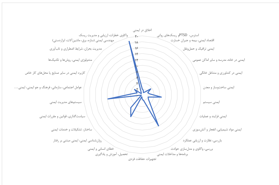
شکل ۳: جهت‌گیری موضوعی بر حسب درصد مقالات منتشر شده در کل مجلات علمی پژوهشی فارسی طی سالهای ۱۳۹۰ الی ۱۴۰۰

تعداد ۹۷ مقاله (۳۷ درصد) با موضوع ایمنی وجود دارد که همانطوری که از جدول پیداست مضمون "واکاوی خطرات، ارزیابی و مدیریت ریسک" دارای بیشترین درصد فراوانی (۱۷،۵۳ درصد) و مضامین متعددی همچون "سیستم‌های مدیریت ایمنی" و "ایمنی در خانه، مدرسه و سایر اماکن عمومی" و "استرس، PTSD و ریسک‌های روانی" و "اخلاق در ایمنی" و "کاربرد ایمنی در سایر صنایع یا محل‌های کار خاص" بدون فراوانی انتشار هستند. مضامین "واکاوی خطرات، ارزیابی و مدیریت ریسک"، "خطای انسانی و ایمنی"، "بررسی، واکاوی و مدل‌سازی حوادث"، "مدیریت بحران، شرایط اضطراری و تاب‌آوری" حدود ۵۰ درصد واریانس مقالات منتشر شده را تبیین می‌کنند.