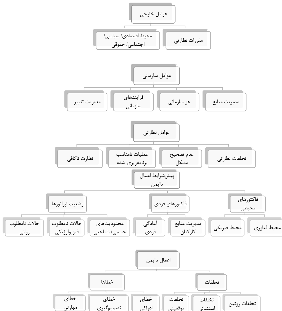
شکل ۱: سطوح و زیر سطوح روش HFACS مورد استفاده

هر چهار سطح عوامل انسانی در بروز حوادث مورد مطالعه در معدن تأثیرگذار بوده و علاوه بر اثربخشی مدل مذکور در تحلیل حوادث بر مبنای اعمال نایمن، می‌توان از آن برای برنامه‌ریزی‌های آینده به‌منظور کاهش حوادث در بخش معدن استفاده کرد (۱۹). نتایج یک مطالعه دیگر با هدف شناسایی و ارزیابی خطاهای انسانی منجر به حوادث در یکی از پالایشگاه‌های گاز ایران، علل بروز حادثه و نقاط