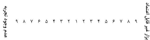
شکل ۲. نمونه ای از مقایسه دو به دو معیارها

سلسله مراتبی طراحی شده و دارای قابلیت تعیین ترجیحات و اولویت و محاسبه وزن نهایی گزینه‌ها را دارا می‌باشد (۲۹، ۳۰).