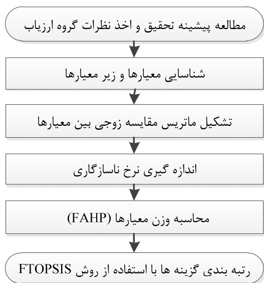
شکل ۱. چارچوب روش پیشنهادی

با توجه به افزایش و رشد پروژه‌های بلندمرتبه‌سازی و خطرات ویژه این نوع ساخت‌وسازها، ارزیابی فرهنگ ایمنی در کارگاه‌های بلندمرتبه‌سازی از اهمیت و ضرورت به‌سزایی برخوردار است. بنابراین کارگاه مورد مطالعه، یک برج اداری-تجاری ۳۳ طبقه فولادی است که در مرحله اجرای اسکلت فلزی و سفت‌کاری قرار داشته و بخشی از یک مگا پروژه تجاری-اقامتی و اداری با زیربنای کل حدود ۶۰۰،۰۰۰ مترمربع محسوب می‌شود. در شکل ۱ جزئیات روش پیشنهادی رتبه‌بندی مشاغل در کارگاه‌های بلندمرتبه‌سازی از نظر فرهنگ ایمنی با استفاده از مدل FTOPSIS-FAHP نشان داده شده است.