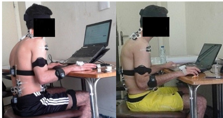
شکل ۱. شرکت کننده در حین کار با لپ تاپ در تنظیمات عادی (سمت راست) و ارگونومیک (سمت چپ)