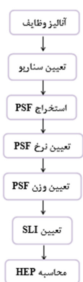
شکل ۲: مراحل اجرای روش SLIM

کارشناسان در ارتباط با فاکتورهای تاثیرگذار بر عملکرد (PSF) نرخ گذاری می‌شود و نیز ابزار ساده و درعین حال قوی برای تعیین احتمال خطای انسانی و در نتیجه ارزیابی قابلیت اطمینان انسانی است و به طور خاص برای ارزیابی احتمال خطای انسانی در شرایط اضطراری معرفی شده است (۱۹). SLIM یکی از تکنیک‌های قطعی پرکاربرد در ارزیابی قابلیت اطمینان انسان است، به‌ویژه زمانی که داده‌ها ناکافی باشند و با نادیده گرفتن وابستگی‌های احتمالی در بین وظایف، احتمال خطای انسانی (HEP) را محاسبه می‌کند. در سال‌های اخیر نسخه ارزیابی مبتنی بر منطق فازی این روش ارائه شده است که تعدادی از کمیت‌ها و یا حالات بر اساس نظر و تشخیص کارشناس ارزیابی می‌گردد. در ارزیابی احتمال خطای انسانی روش SLIM صرفاً رنج حداقل را نمایش داده در حالی که روش Fuzzy SLIM، مقدار حداقل، حد وسط و حداکثر را نشان می‌دهد. و نیز به دلیل وجود عدم قطعیت و عدم دقت روش سنتی SLIM در ارزیابی احتمال خطای انسانی (HEP)، از تکنیک منطق فازی در این مطالعه استفاده شد زیرا در این تکنیک‌ها با تعیین متغیرهای زبانی مثلثی شکل (شامل مجموعه‌ای از ۹-۵ مقادیر زبانی کیفی بسیار بالا، بالا، متوسط، پایین و خیلی پایین) برای نظر یک