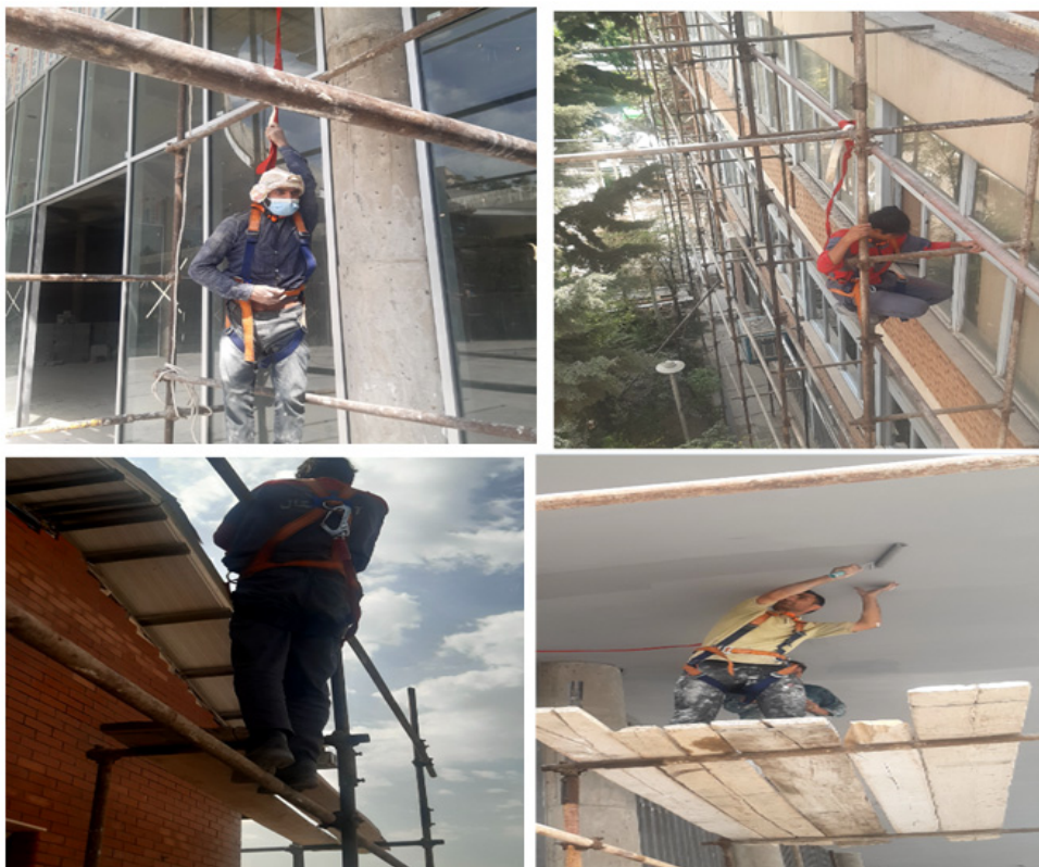
شکل ۳: تصاویری از نحوه استفاده از هارنس توسط کارگران شرکت کننده در این مطالعه