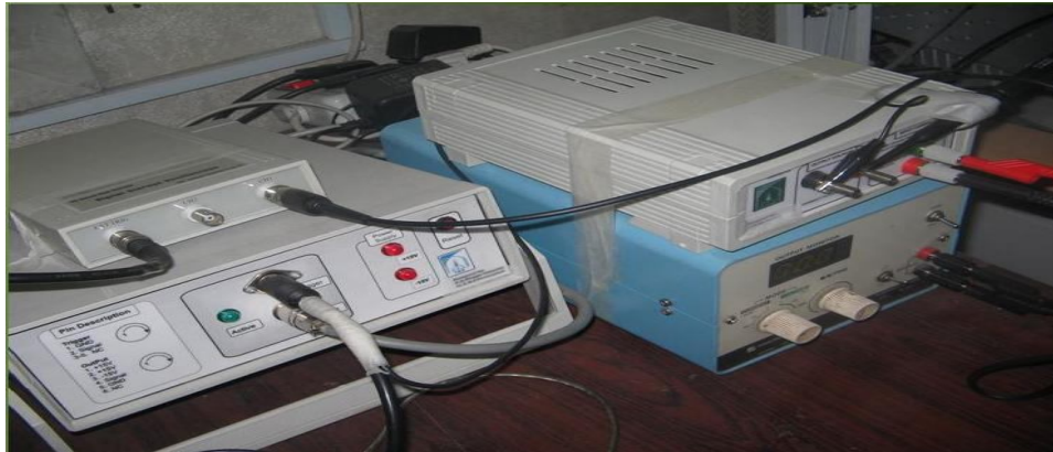
شکل 1- دستگاه ساخته شده در مطالعه

در ایران صورت گرفت. هدف از این مطالعه بررسی تکرارپذیری