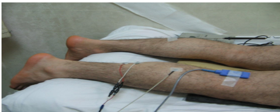
شکل 2- چگونگی قرار گیری فرد و الکترودهای ثبت و تحریک و دماسنج (ثبت در آزمایشگاه الکتروفیزیولوژی دانشگاه تربیت مدرس)

این مطالعه توصیفی در 6 فرد داوطلب سالم، 2 زن و 4 مرد با میانگین سنی 26/33 \pm 1/033 سال با روش نمونه‌گیری در دسترس، انجام شد. هر 6 نفر راست‌پا و غیر ورزشکار بودند. روند مطالعه توسط کمیته اخلاق دانشگاه تربیت مدرس تایید شد. معیارهای ورود عبارت بودند از: سلامت عصبی عضلانی اسکلتی و نداشتن محدودیت حرکتی در مچ پا و زانو. معیارهای خروج عبارت بودند از: استفاده از داروهای موثر بر سیستم عصبی عضلانی اسکلتی، اختلالات حسی و انجام ورزش حرفه‌ای حداقل سه روز در هفته. پس از گرفتن موافقت کتبی، داوطلب فرم اطلاعات زمینه‌ای را پر می‌کرد و پس از اطمینان از سلامت فرد، خواب کافی شبانه، عدم خستگی عمومی و عضلانی و عدم مصرف داروهای مسکن و آرامبخش و پس از تطابق فرد با شرایط محیطی، ثبت پاسخ H' در ساعات بین 8-11 صبح صورت -