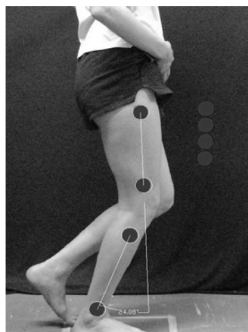
شکل ۲- وضعیت تست افراد در وضعیت ایستاده (دامنه خارجی)

بعد از تست وضعیت نشسته، از فرد خواسته می‌شد ۲ دقیقه راه برود. سپس به فرد آموزش داده می‌شد که حرکت semi squat را به نحوی انجام می‌دهد که در هر ثانیه زانو ۱۰ درجه خم شود. سپس فرد مورد آزمایش در وضعیت ایستاده قرار می‌گرفت و از او خواسته می‌شد تا در شروع تست پای غیر تست خود را، در حدی که فقط کمی از زمین فاصله داشته باشد، از زمین جدا کرده و دست سمت پای تست را نیز بر روی تنه خود برای جلوگیری از پنهان شدن مارکرها بگذارد. همچنین سر خود را صاف نگاه دارد (برای جلوگیری از تحریک سیستم وستیبولار) و تنه را به سمت عقب و یا جلو متمایل نکند (برای یکسان بودن گشتاورهای ایجاد شده در مفاصل اندام تحتانی در همه افراد). از فرد درخواست می‌شد تا در حدی که فقط برای حفظ تعادل کافی باشد، دست سمت غیر تست را به دیوار تماس دهد. سپس در حالیکه چشمان فرد مورد آزمایش بسته بود از وی خواسته می‌شد با همان سرعتی که به وی