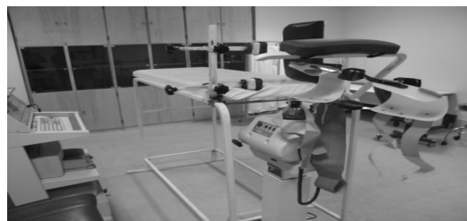
شکل 1- چیدمان ساخته شده مورد استفاده جهت اندازه‌گیری سفتی عضلانی

رکتوس فموریس از یک تخت معاینه استفاده شد که برای مناسب نمودن آن، 110 سانتیمتر به پایه‌های آن افزوده شد (شکل 1). فرد مورد آزمون روی پهلوئی راست به گونه‌ای روی تخت می‌خوابید که ستیغ ایلیاک سمت راستش روی لبه تخت تکیه داشت و تروکانتر بزرگ فمور بیرون تخت قرار می‌گرفت. لگن فرد از عقب به یک صفحه پشتی تکیه داده می‌شد و از جلو با قرار دادن دو ابزار بی حرکتی روی برآمدگی‌های خار خاصه قدامی فوقانی و ثابت کردن آنها، لگن کاملاً بی حرکت می‌شد.