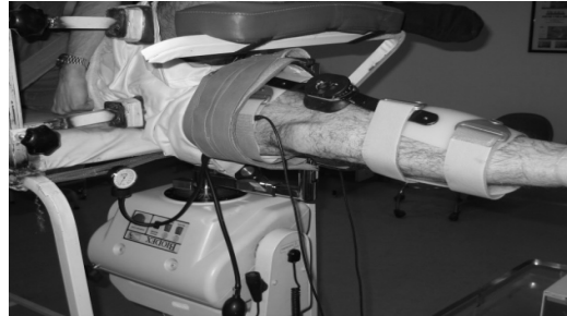
شکل 2- آزمون سفتی عضلات همسترینگ و رکتوس فموریس از سر پرو گزیمال در وضعیت زانوی راست

فموریس از سر بالا در همان وضعیت که فرد مورد آزمون به پهلو روی تخت مورد نظر خوابیده بود. اندام تحتانی سمت راست فرد درون یک بریس زانو با 2 بار جانبی و قفل مدرج که به بازوی دستگاه ایزو کینتیک بیودکس سیستم 3 وصل می‌شد قرار می‌گرفت. با استفاده از یک فشار سنج دیجیتالی مدل Activita Station در فاصله پوست و سطح بریس، فشار وارده از طرف بریس روی سطح اندام همه افراد مورد آزمون مساوی