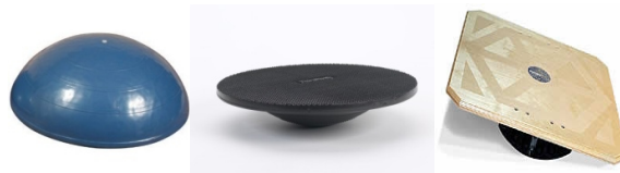
شکل ۴ - وسایل اغتشاش دهنده: از راست به چپ: Bosu، تخته تعادل چند جهته و تخته تعادل یک جهته

بعد از ارزیابی‌ها، آزمودنی‌ها بطور تصادفی به دو گروه مداخله و کنترل (هر کدام ۱۰ نفر) تقسیم شدند. گروه مداخله ده جلسه، در هر هفته سه تا چهار جلسه بر روی تخته تعادل بر اساس پروتکل فیتز جرالده اصلاح شده (Modified Fitzgald) اغتشاش درمانی شده و برنامه معمول ورزشی خود را نیز پی می‌گرفتند. تمرینات اغتشاشی بر روی تخته تعادل یک جهته (Rocker board)، تخته تعادل چند جهته (Wobble board) و تخته تعادل گنبدی (Bosu) انجام شد (شکل ۴). در