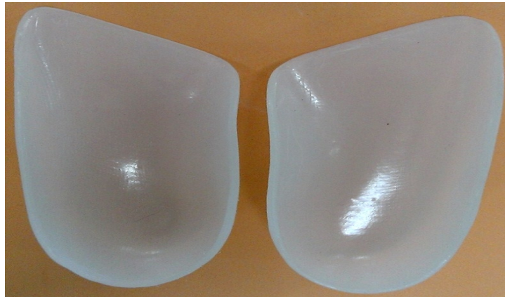
شکل ۱- کفی گیت‌پلیت

استفاده از ارتوز و کفش برای اصلاح راهرفتن با پنجه رو به داخل یک موضوع در حال بحث است که برخی از محققین کاملاً آن را بی‌تأثیر (۲۶، ۲۷) و برخی دیگر آن را مؤثر می‌دانند (۱۳، ۲۸، ۲۹) و در این زمینه اتفاق نظر وجود ندارد. یکی از درمان‌هایی که در برخی مطالعات اثر بخش اعلام شده است، کفی گیت‌پلیت می‌باشد (۲، ۱۳، ۲۳، ۳۰). کفی گیت‌پلیت یک صفحه پلاستیکی سخت می‌باشد که کل سطح کف‌پایی را تا سر متاتارس‌ها در بر می‌گیرد؛ بصورتیکه در سمت خارج تا پشت انگشت پنجم و در سمت داخل تا پشت سر متاتارس اول جلو می‌آید (تصویر ۱) (۱۴). Shuster و همکاران در سال ۱۹۶۷ اولین مقاله مکتوب در خصوص تأثیر کفی گیت‌پلیت بر زاویه راهرفتن