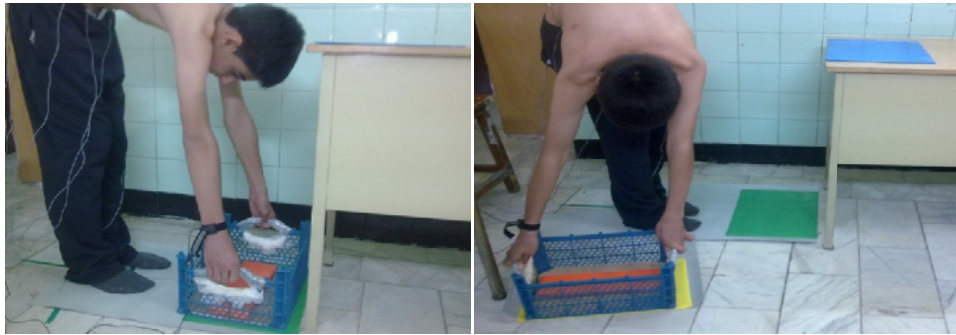
شکل ۱- وضعیت شروع در حالت قرینه شکل ۲- وضعیت شروع در حالت غیرقرینه

نحوی که سبد بر روی میز در محلی که قبلاً توسط مارکر مشخص شده بود قرار گیرد. فرد پس از انجام مراحل فوق کنار میز بر روی صندلی به مدت سه دقیقه استراحت کرده و سپس در مراتب بعدی بلند کردن وزنه‌ها قرار گرفت. در ابتدا الگوی قرینه را انجام داد و در مرتبه بعدی با چرخش و قرارگیری امتداد خط عمود بر میانه خط بین دو مائل داخلی به میزان ۷۵ درجه چرخش به راست، مراتب غیر قرینه شبیه به حالت اول به نحوی انجام شد که پس از خم شدن فرد و دریافت سبد حامل وزنه، آن را نسبت به قرارگیری در صفحه ساجیتال بر روی میز هدف شبیه به حالت قرینه قرار دهد (شکل ۲). شرایط تغییر وزنه‌ها و استراحت بین حمل هر وزنه شبیه به حالت قرینه بود.