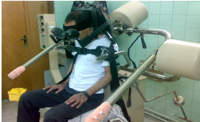
شکل ۱- ایجاد خستگی پویا

۳-عضله ک لواتور اسکاپولا: جفت الکترودهای سطحی در هر طرف بین لبه ک خلفی عضله ک SCM و لبه ک قدامی بخش نزولی عضله ک تراپزیوس قرار داده می شد. (۷) داده‌های الکترومیوگرافی سطحی ثبت شده از عضلات مورد مطالعه در دو بخش توان و فرکانس مورد بررسی قرار گرفت. برای نرمال کردن RMS های به دست آمده، RMS قبل و بعد از خستگی پویا را بر RMS_{Max} تقسیم کردیم. متغیرهای این مطالعه بر اساس آزمون Kolmogorov-Smirnov از توزیع نرمال برخوردار بودند ( P > 0.05 )، بنابراین از آزمون های پارامتریک (Paired T-test) در تجزیه و تحلیل داده ها استفاده شد. فاصله ک معنادار بودن آماری P < 0.05 تعیین شد.