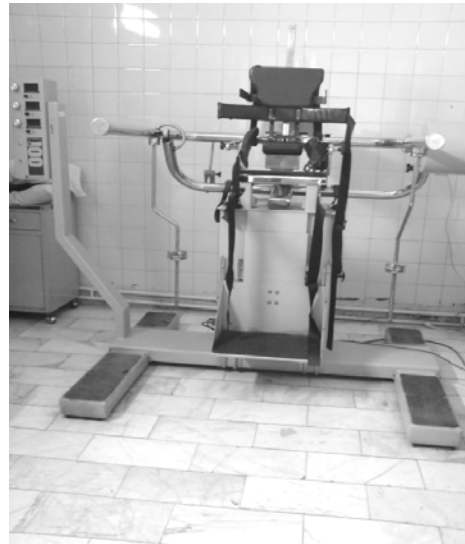
شکل ۱ - دستگاه ایزواستیشن B200

می‌شود. این دینامومتر سه محوری می‌تواند به طور همزمان شاخص‌های اصلی حرکت یعنی وضعیت زاویه‌ای، سرعت زاویه‌ای و گشتاور را در سه محور عمده حرکتی کمر (فرونرال، ساجیتال، ترانسورس) و از طریق نه کانال محاسبه کند. از روی این شاخص‌ها پارامترهای دیگری همچون دامنه حرکتی، حداکثر و متوسط گشتاور و سرعت که برای ارزیابی دقیق حرکات ضروری اند ثبت می‌شوند (۱۱). در شروع آزمایش، فرد با پروتکل آزمایش آشنا می‌شد.